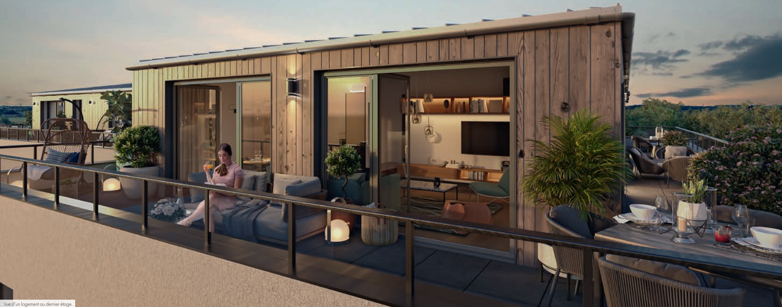
Vue d'un logement au dernier étage.