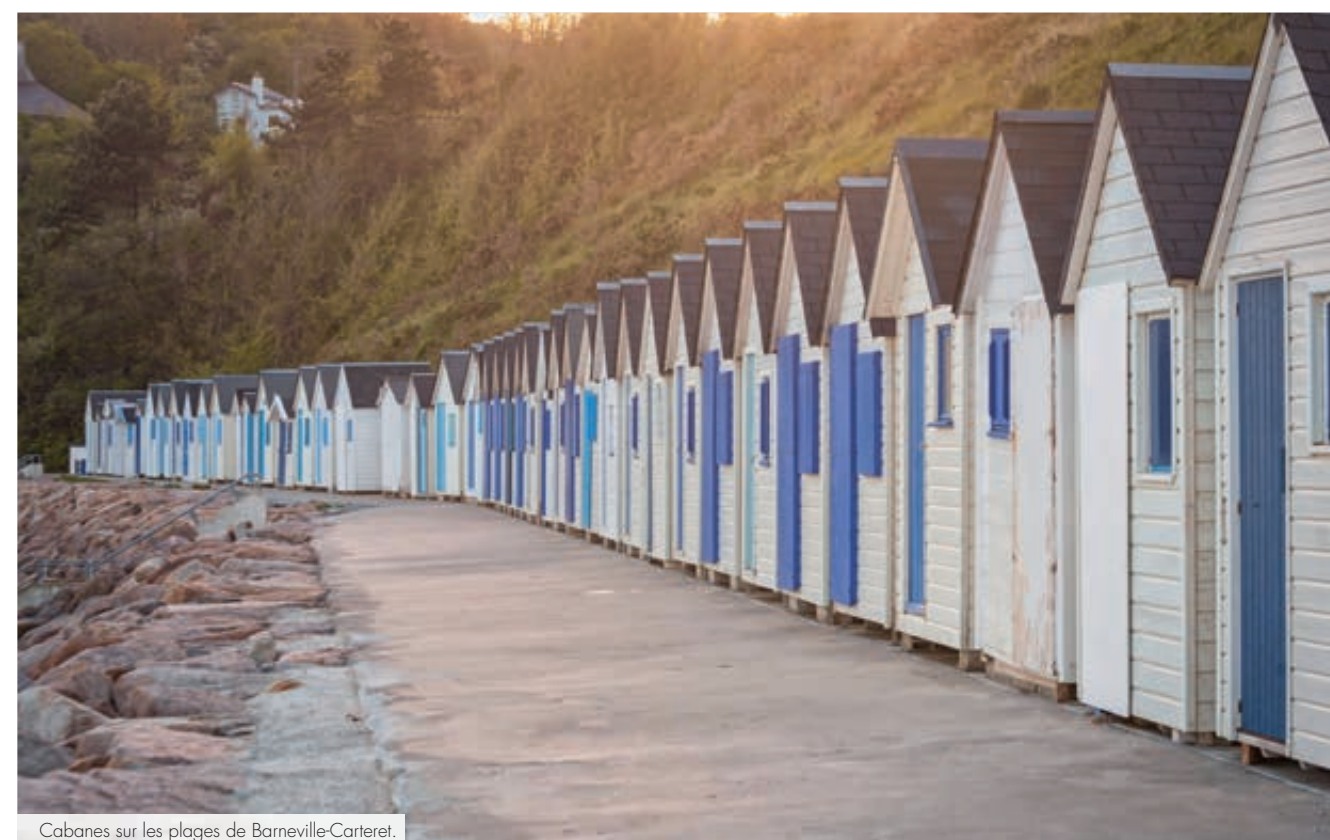
Cabanes sur les plages de Barneville-Carteret.