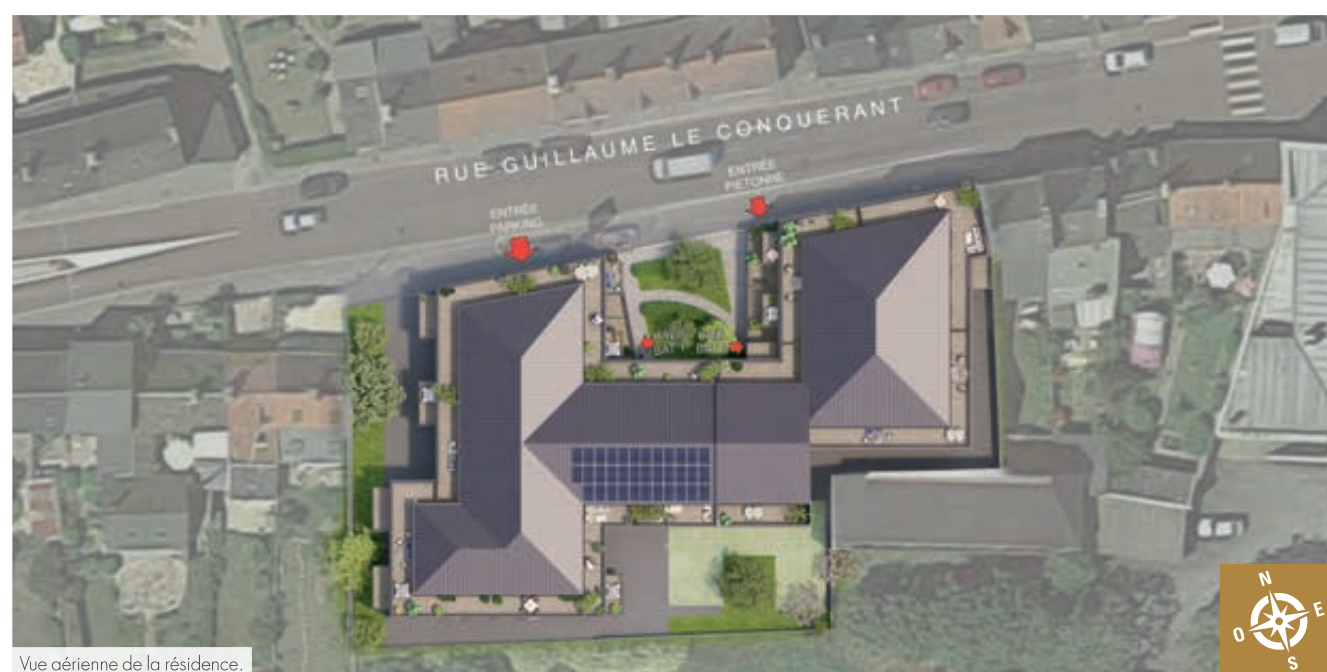
Vue aérienne de la résidence.