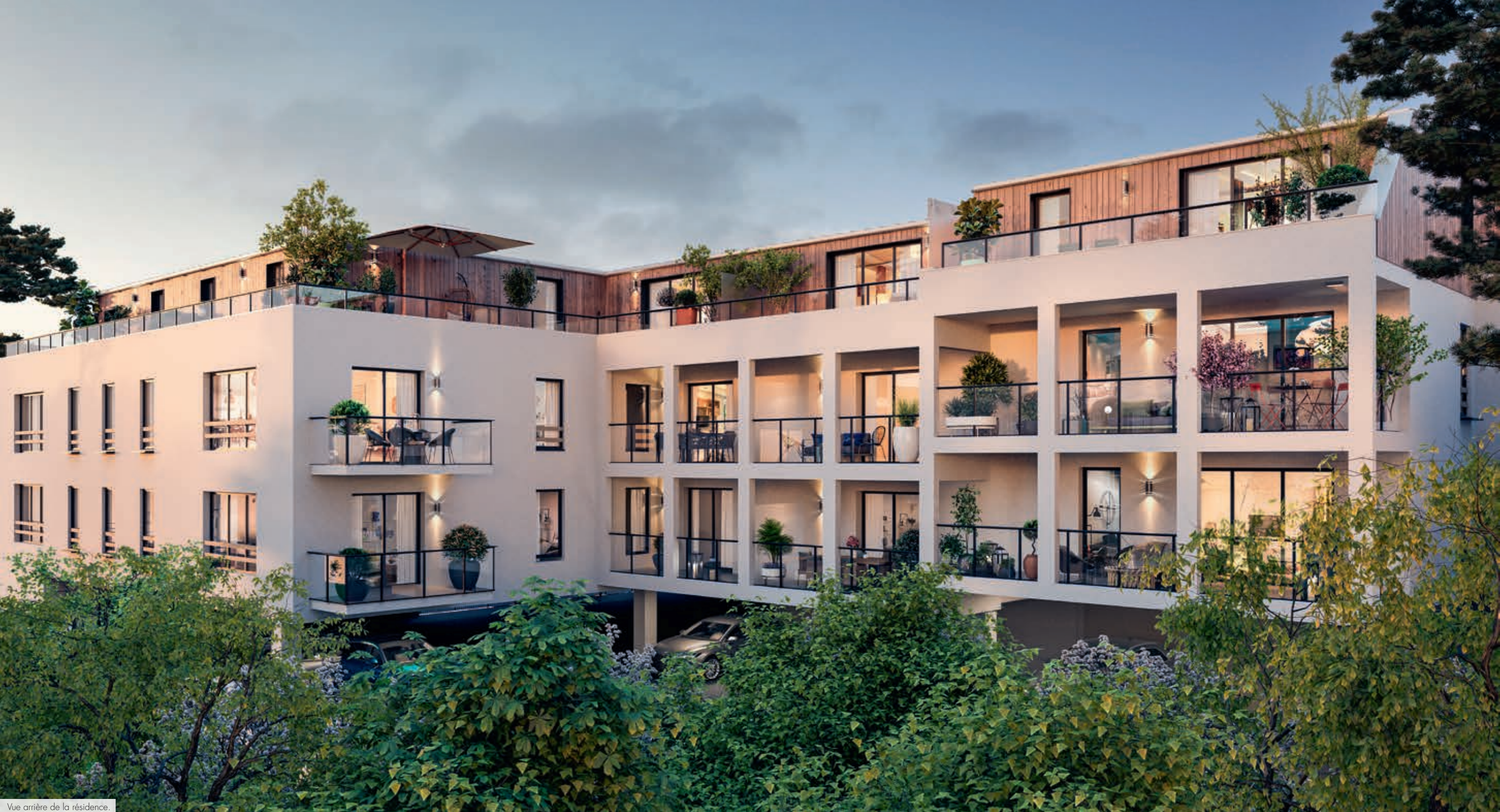
Vue arrière de la résidence.