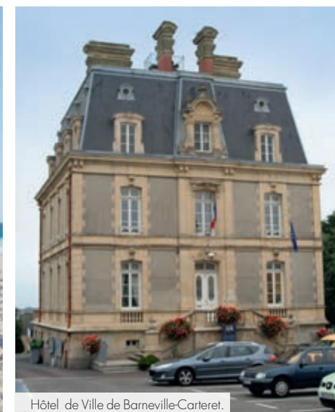
Hôtel de Ville de Barneville-Carteret.