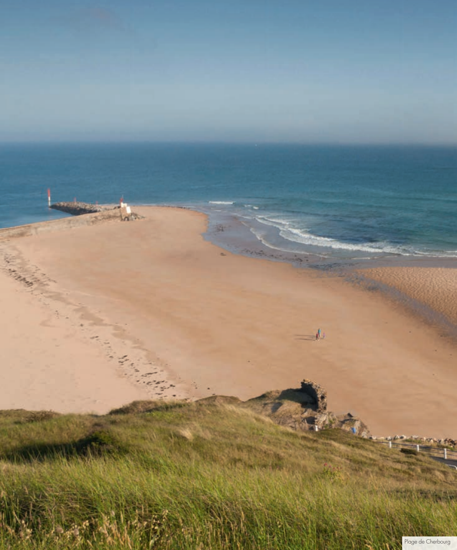
Plage de Cherbourg

Ville dynamique, elle dispose en outre de tous les essentiels et de structures scolaires allant jusqu'à la primaire. Barneville-Carteret profite par ailleurs du rayonnement de Cherbourg, capitale du Cotentin à seulement 40 minutes*, de ses chantiers navals, de la célèbre cité de la mer et de ses multiples attractions. Caen et sa belle dynamique se rejoint quant à elle en 1 h 30* seulement par la N13.