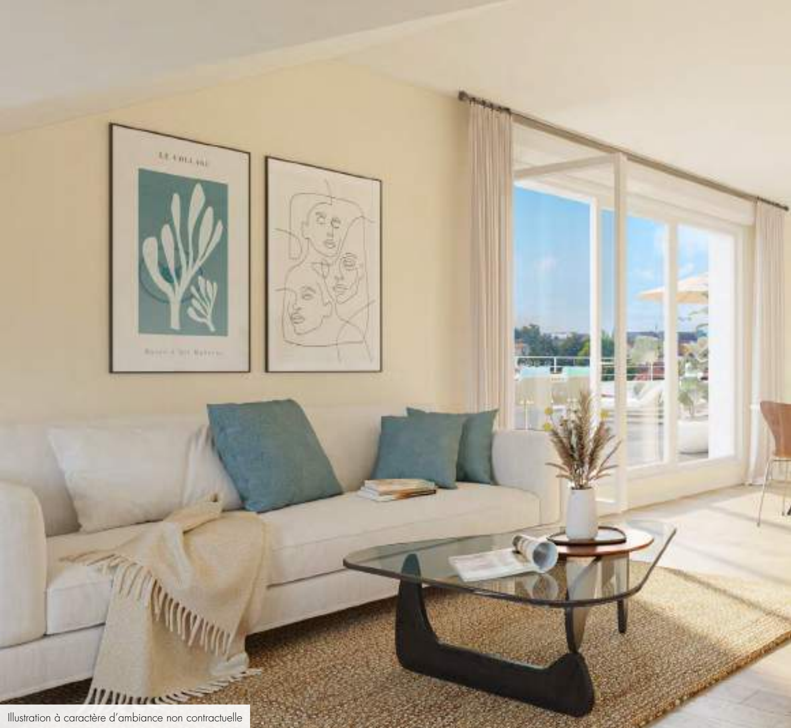
Illustration à caractère d'ambiance non contractuelle