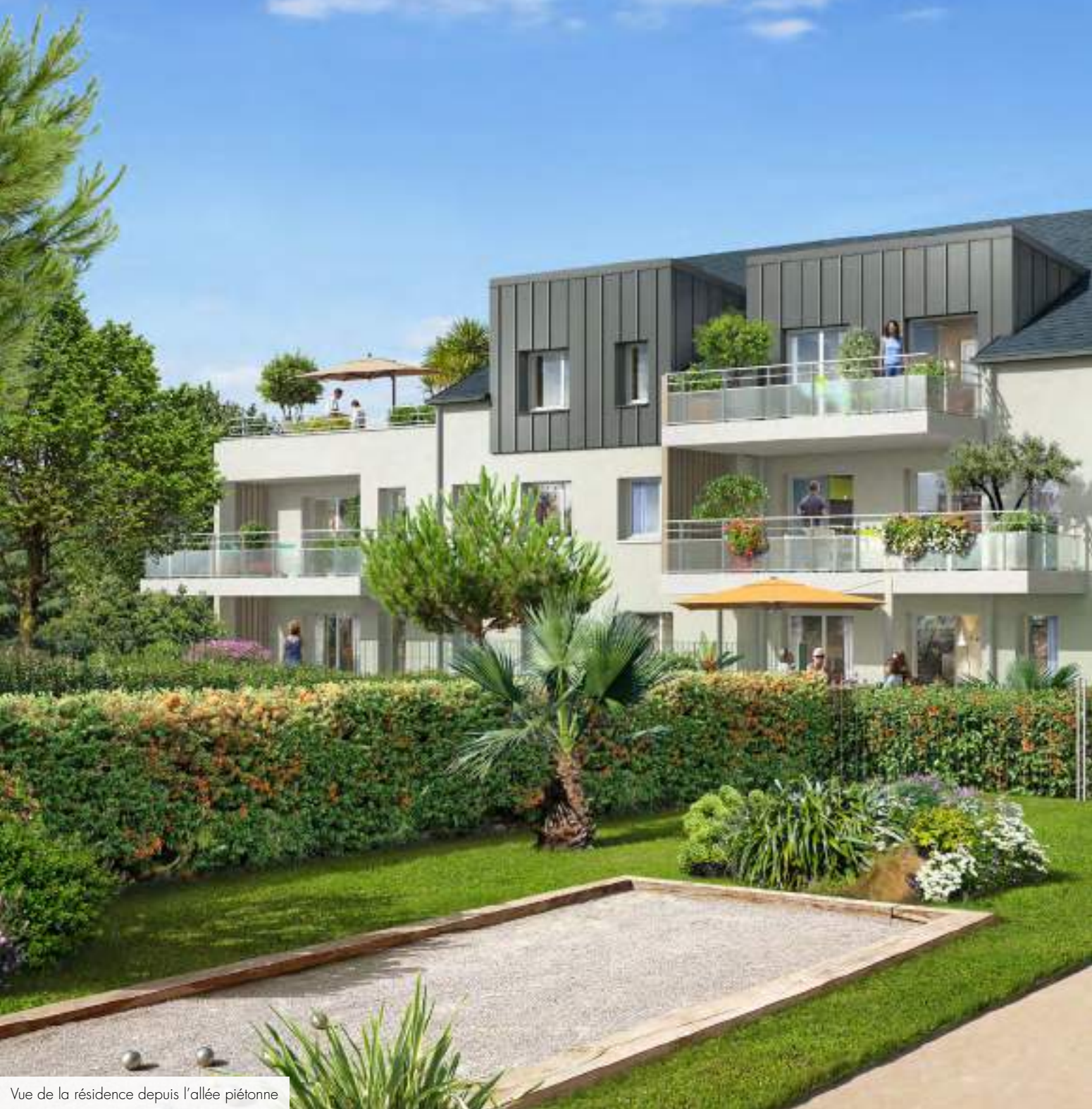
Vue de la résidence depuis l'allée piétonne