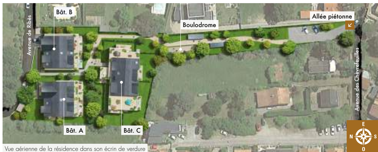
Vue aérienne de la résidence dans son écrin de verdure