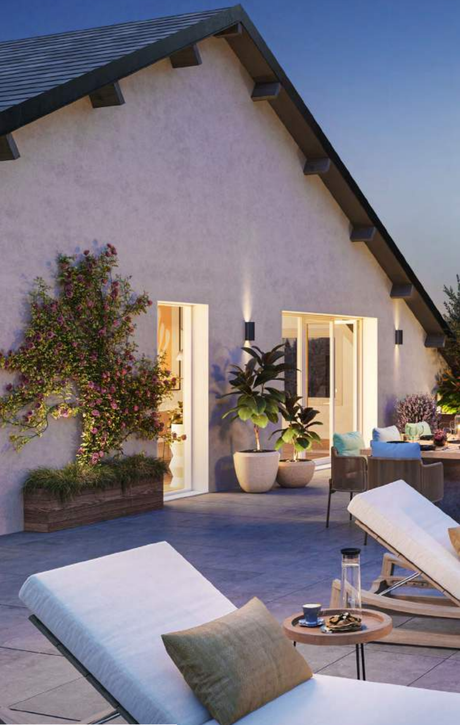
Vue d'une généreuse terrasse en attique (appartement n° C202)