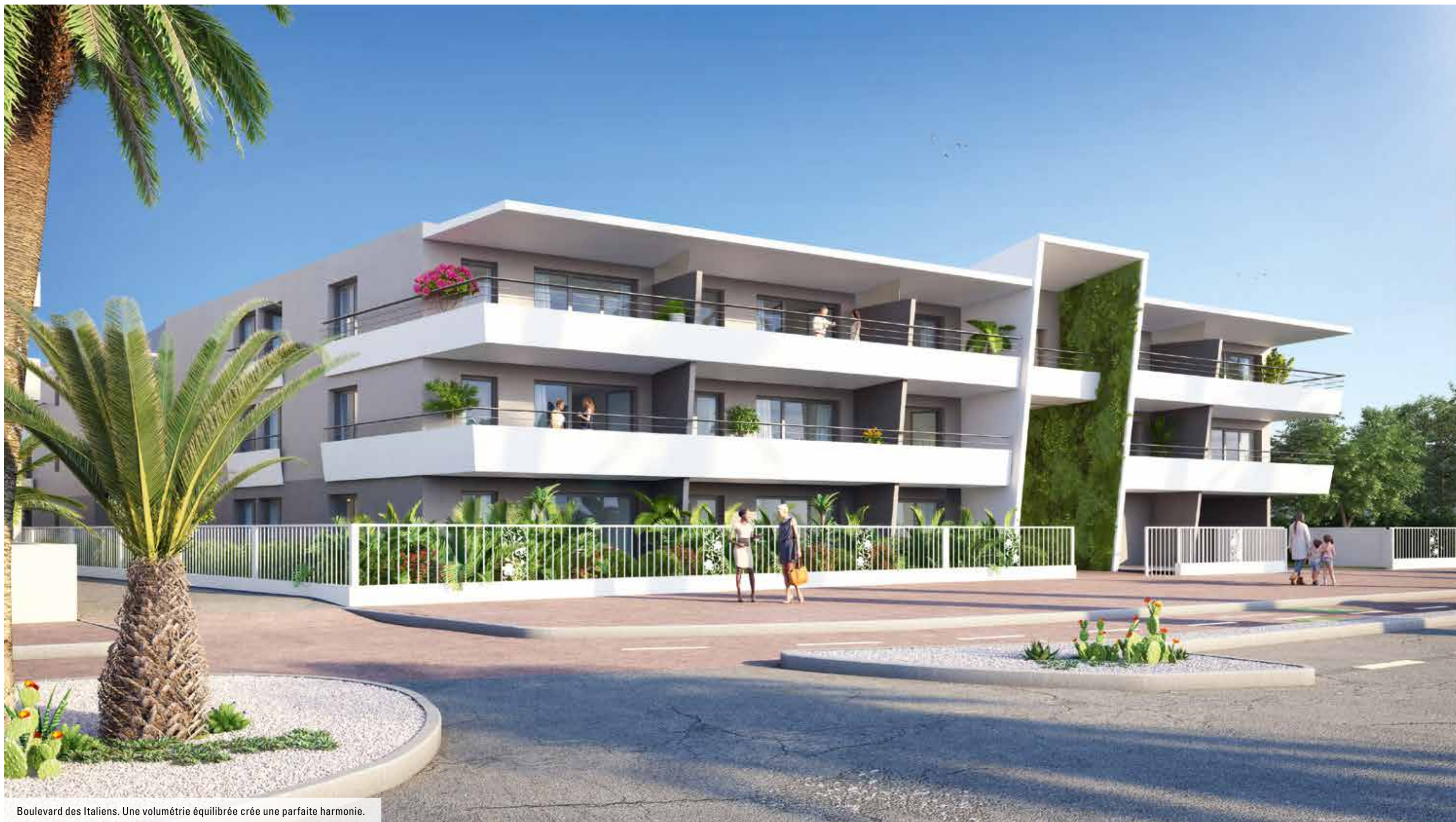
Boulevard des Italiens. Une volumétrie équilibrée crée une parfaite harmonie.