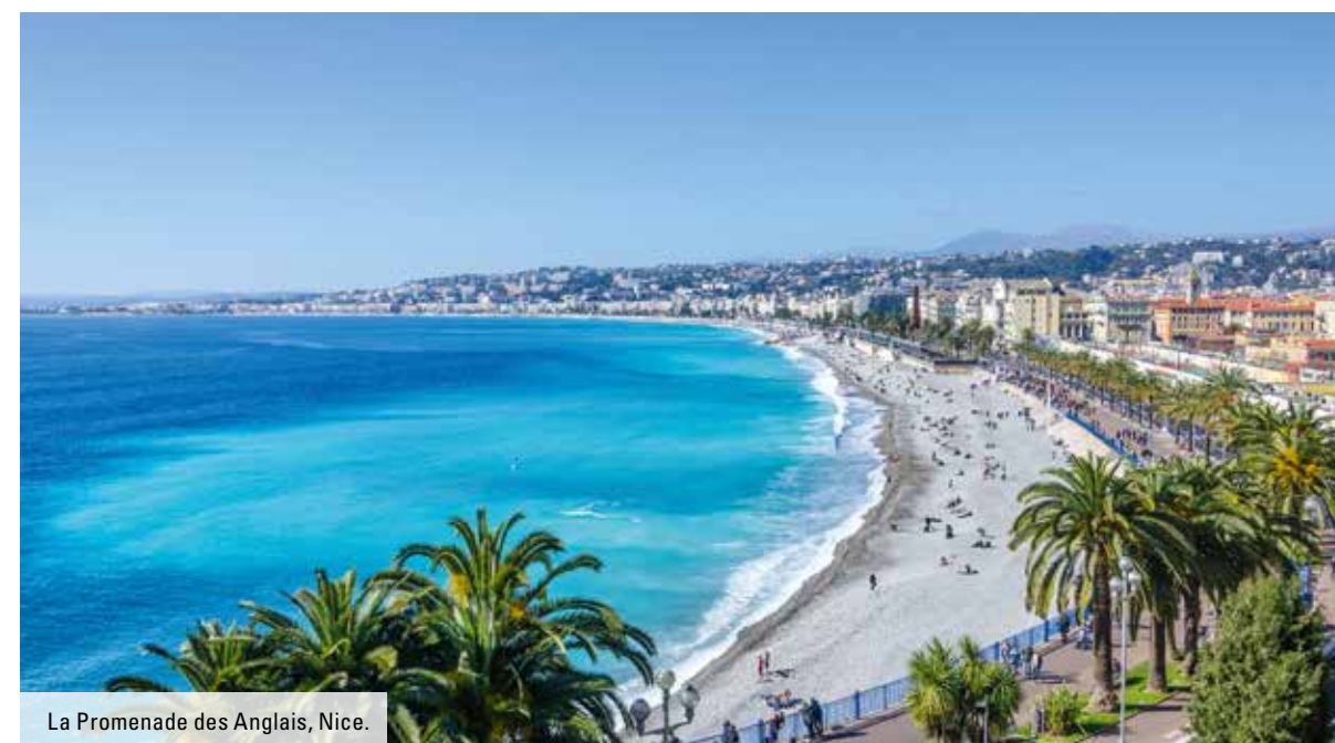
La Promenade des Anglais, Nice.