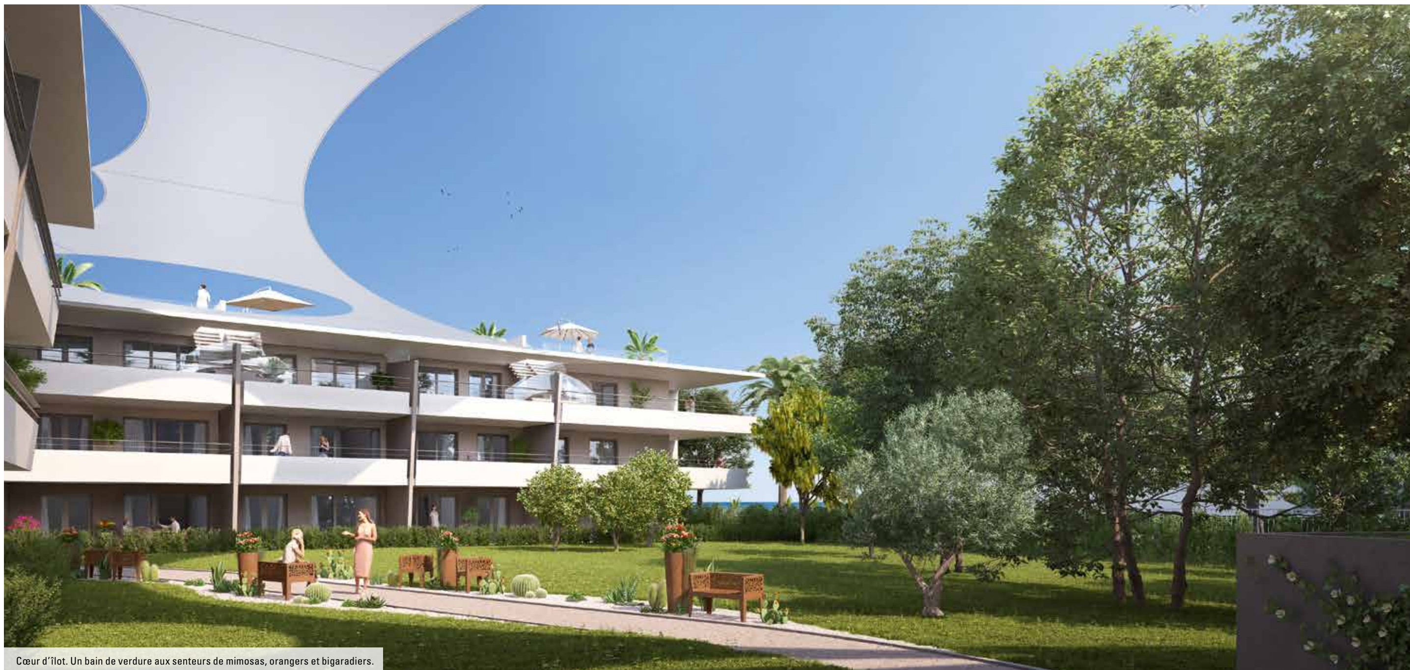
Cœur d'îlot. Un bain de verdure aux senteurs de mimosas, orangers et bigaradiers.