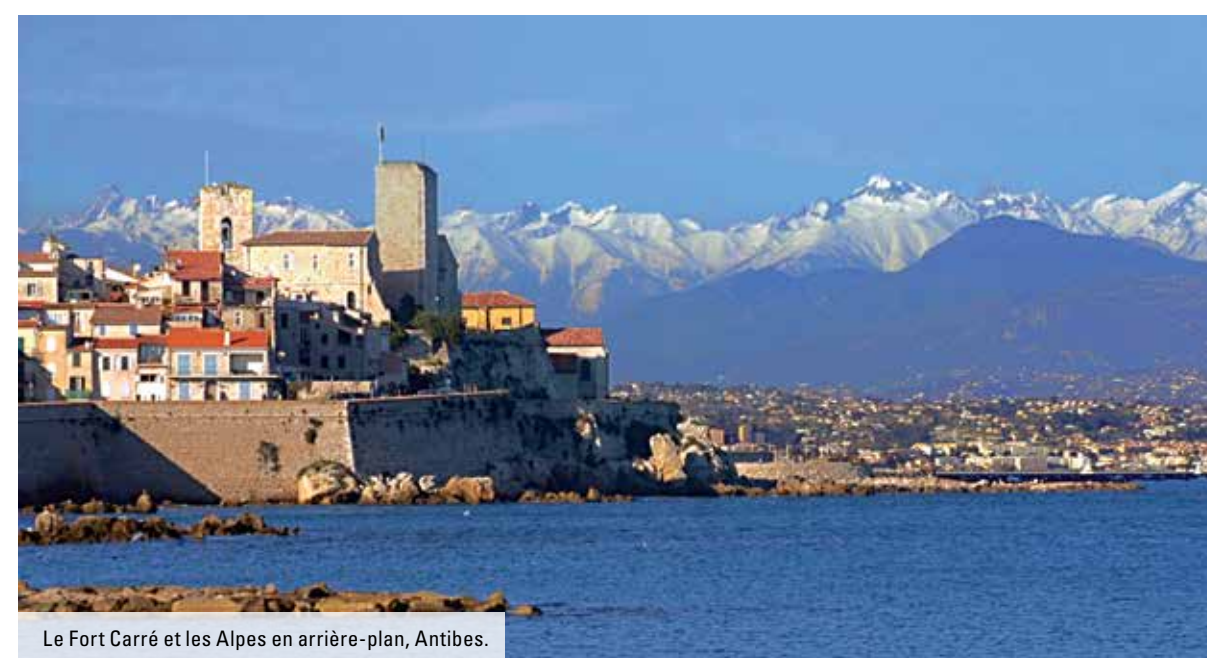
Le Fort Carré et les Alpes en arrière-plan, Antibes.