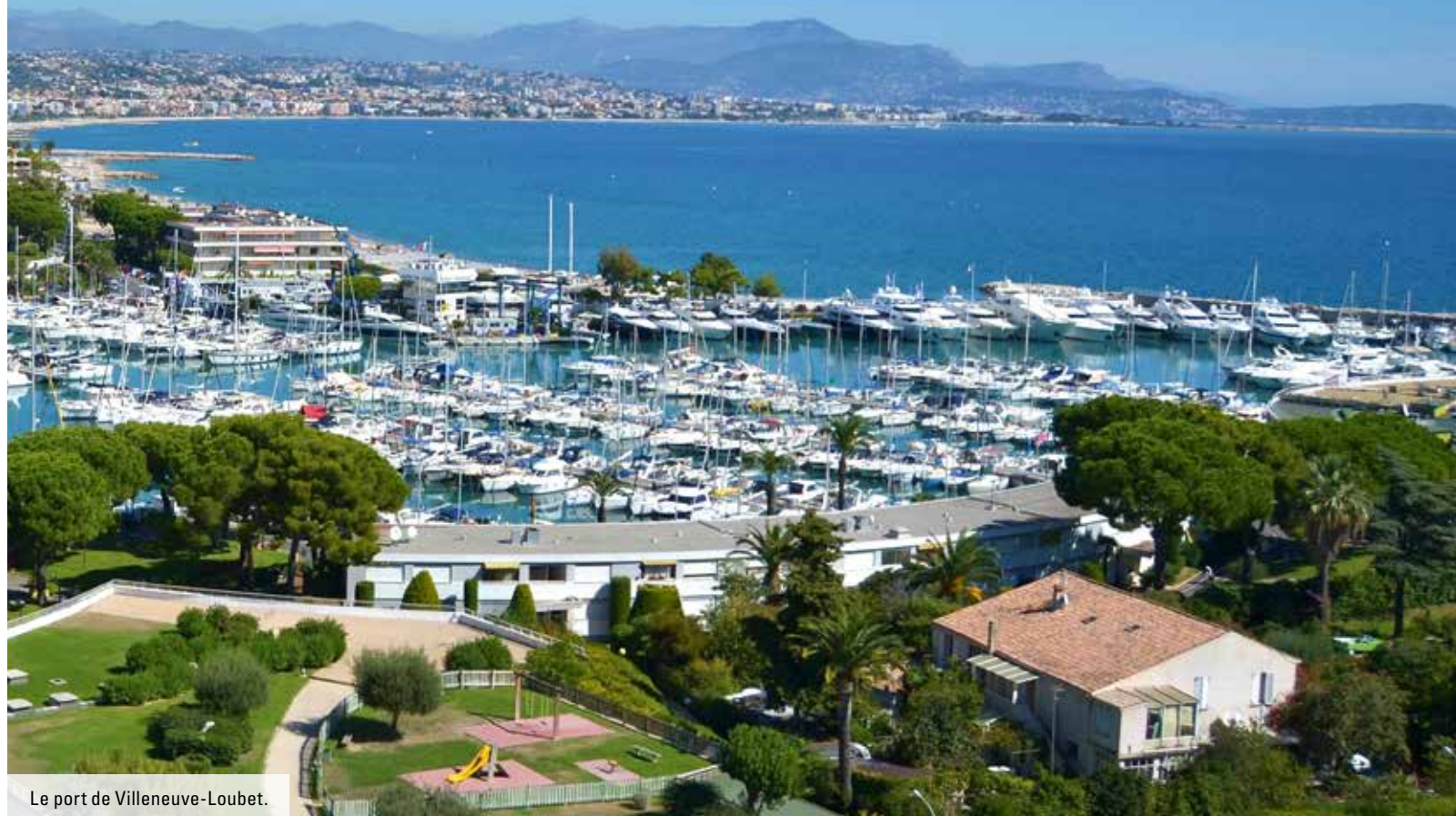
Le port de Villeneuve-Loubet.

À deux pas de tous les services de Villeneuve-Loubet et de l'animation de la Riviera... C'est tout cela Pearl Beach.