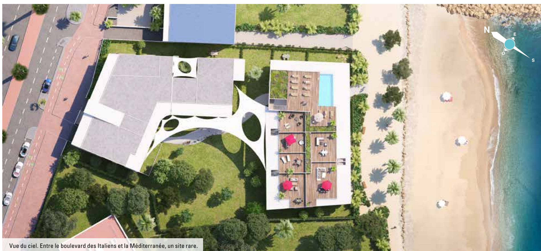
Vue du ciel. Entre le boulevard des Italiens et la Méditerranée, un site rare.