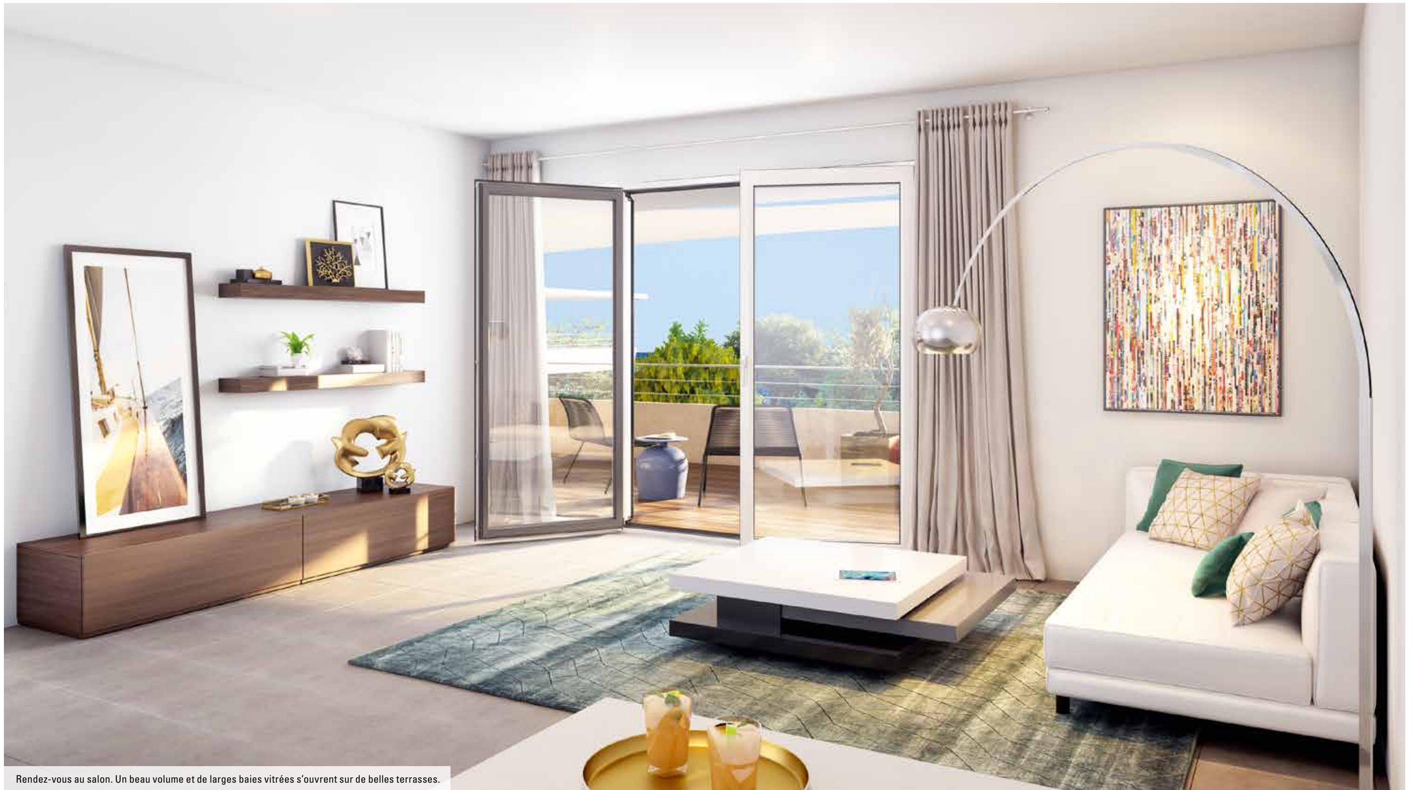
Rendez-vous au salon. Un beau volume et de larges baies vitrées s'ouvrent sur de belles terrasses.