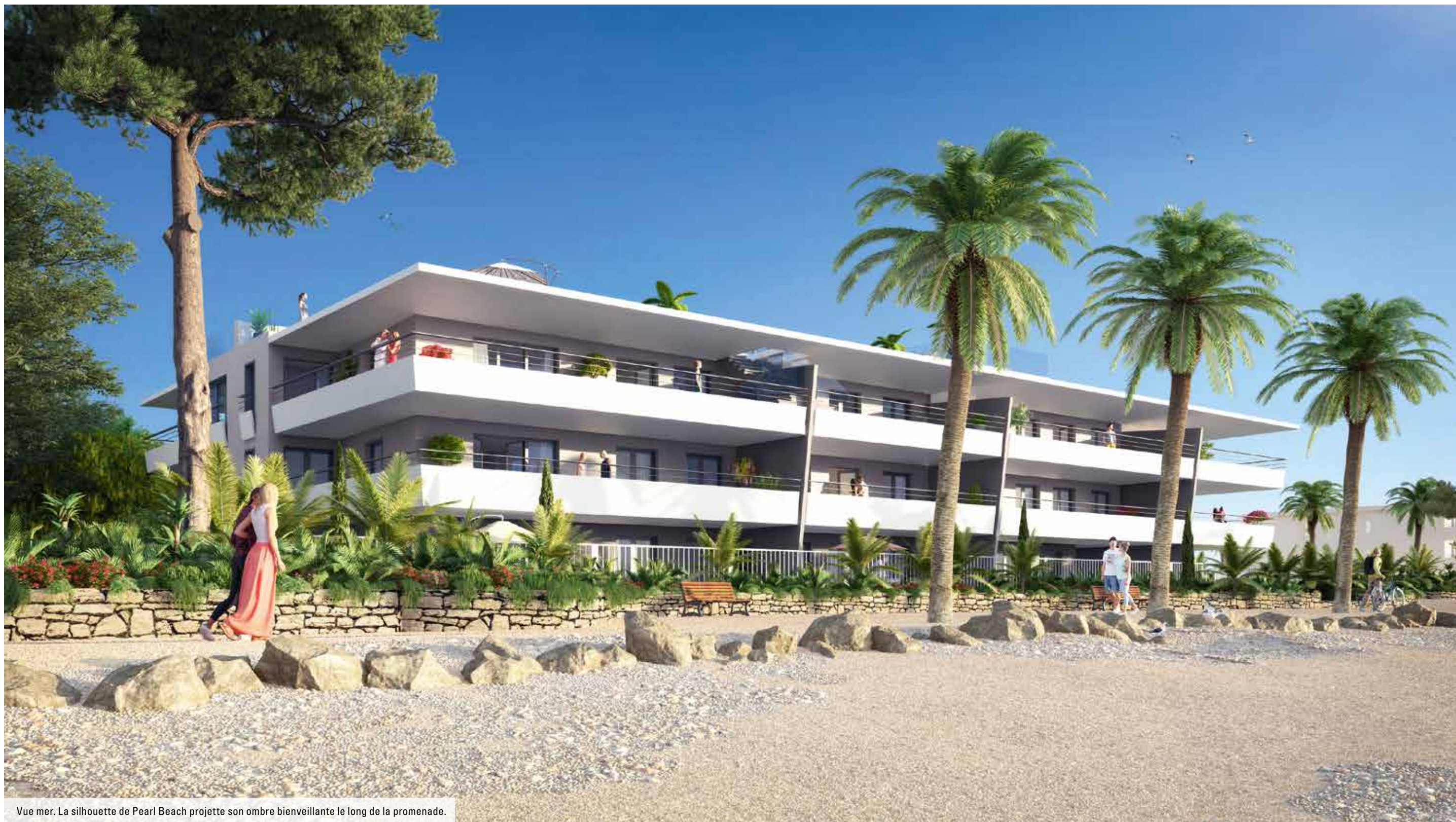
Vue mer. La silhouette de Pearl Beach projette son ombre bienveillante le long de la promenade.